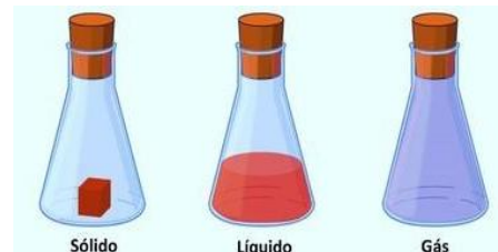
Volume da matéria em diferentes estados físicos.

1. Um sólido tem volume definido, pois suas partículas estão fortemente unidas. 2. Um líquido tem volume específico, mas assume a forma do recipiente em que é colocado. 3. Um gás preenche o volume total do recipiente que está, pois suas partículas se movimentam em todas as direções e com grande velocidade.